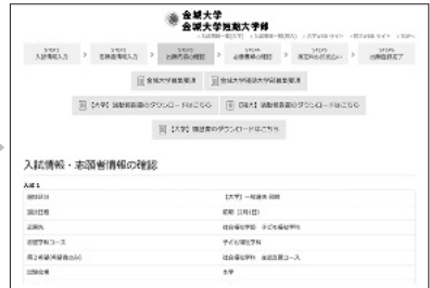
④入試情報・志願者情報の確認