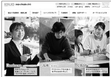
本学ホームページトップページ