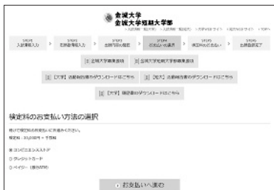
⑤検定料の支払方法の選択

検定料の支払方法を選択してください。 クレジットカードの場合は、続けてカード情報を入力してください。