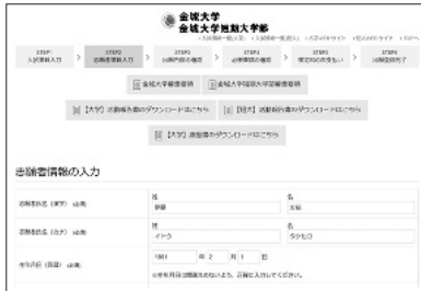
②志願者情報の入力