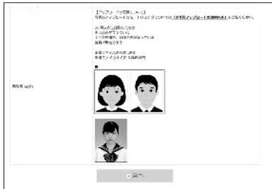
③写真データのアップロード